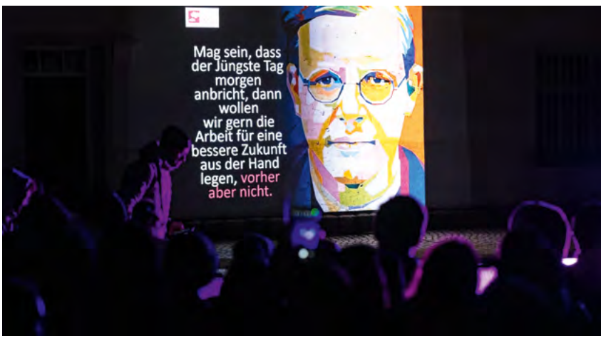
Gedenkveranstaltung zum 80. Todestag Dietrich Bonhoeffers in Flossenbürg 2025.

weg und stärkt für gesellschaftliches Engagement. Andachten am Todesort, gemeinsames Singen und Beten in verschiedenen Sprachen – solche Momente zeigen die grenzüberschreitende Kraft des Glaubens.