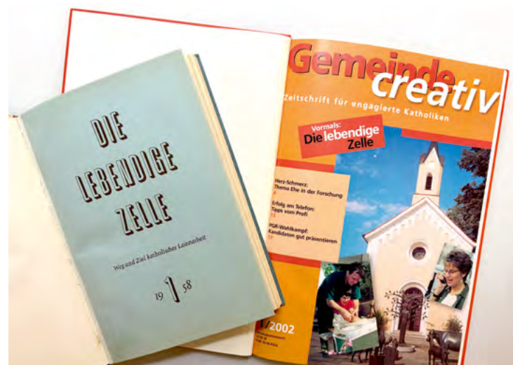
Zwischen Mikrobiologie und Schlüsselbegriff: Die Zeitschrift des Landeskomitees steht mit beiden Titeln ein für die Arbeit vor Ort und als Handreichung und Hilfe für kreative Wandlungsprozesse in Gegenwart und Zukunft.